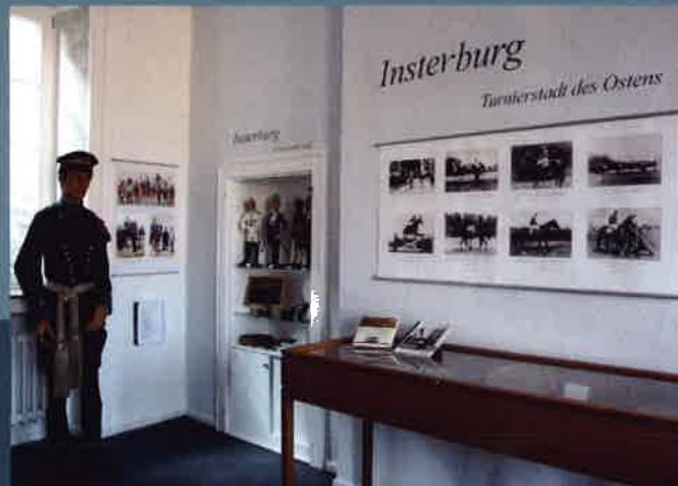
Insterburg - Garnisonsstadt und Turnierstadt des Ostens